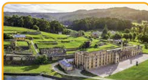
亚瑟港监狱遗址 Port Arthur*