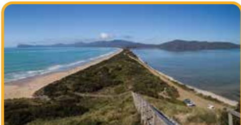
布鲁尼岛南北一线 The Neck