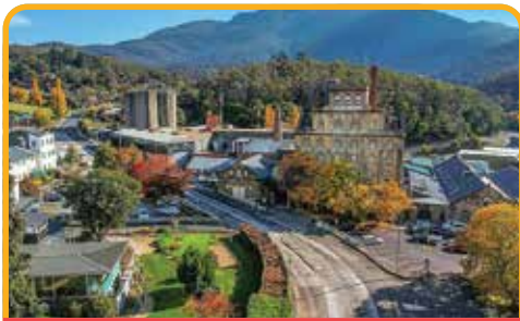
啤酒厂 Cascade Brewery