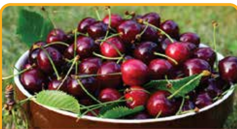
采摘车厘子 Cherry Picking*