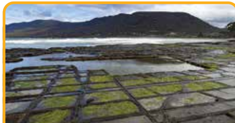
棋盘道 Tessellated Pavement