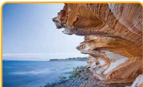
Hopground 海滩彩绘崖 Painted Cliffs

之后沿风景秀丽的德文特河逆流而上, 途径数不清的果园、牧场和啤酒花农场, 前往 费尔德斯国家公园 Mt Field National Park 。拥有着小岛不常见的瀑布群, 漫步世上少有的温带雨林, 参观著名的 罗素瀑布 Russell Falls 和 马蹄瀑布 Horseshoe Falls 。罗素瀑布呈三级, 在郁郁葱葱的草木映衬下显得错落有致、格外优雅。当然, 说是瀑布也没有平常认为的那么激流之下, 而是在一个不太高的石岩中, 温柔地倾泻, 连呼吸都是质朴的。