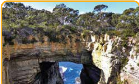
塔斯曼拱门 Tasman Arch