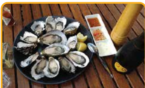
品尝塔州最美味的生蚝 Oyster Farm*

Note: Solo traveller have to pay a single supplement. Child <12 utilising existing bedding with breakfast.