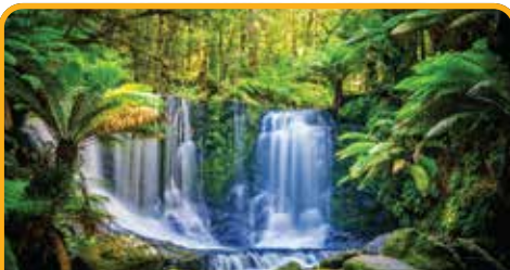
菲尔德斯山国家公园 Mt Field National Park