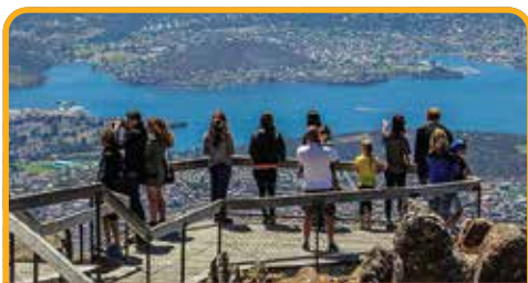
南天第一峰：惠灵顿山 Mt Wellington