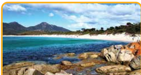
酒杯湾 Wineglass Bay