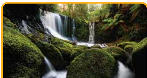
菲尔德斯国家公园 Mt Field National Park