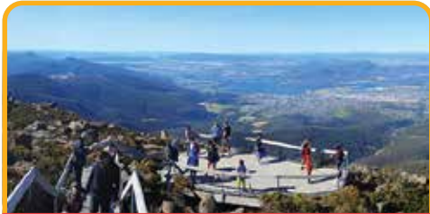
南天第一峰: 惠灵顿山 Mt Wellington

接机后，前往 萨拉曼卡广场 Salamanca Place ，每逢周六便汇集了众多优质艺术品、蔬果、街头艺人等。之后出发前往 采摘最出名的塔斯马尼亚车厘子* (自费, 12月中-1月中) Cherry Picking* (at your own expense, mid Dec to mid Jan) 。之后登上海拔 1270 米的 南天第一峰: 惠灵顿山 Mt Wellington ，远眺南极，是俯瞰霍巴特城市全貌的绝佳位置。游览 澳大利亚最古老的啤酒厂 (外观) Cascade Brewery (overview) ，在这里您将有机会品尝不同口味的澳洲啤酒。行程的最后来到独具风韵的 里奇蒙 Richmond ，小镇有 澳大利亚最古老的石桥 Stone Bridge 和 最古老的天主教堂 Church ，是澳大利亚保存最完善的古镇，体验时光倒流 180 年，邂逅昨夜梦中的怀旧世界。可以去小镇上的糖果屋和网红面包店，品尝一下颇有名气的扇贝派哦。