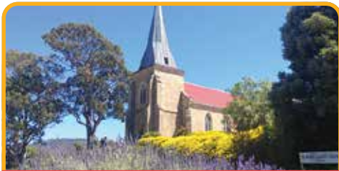
澳大利亚最古老的天主教堂 Church

早餐后，前往 皇家植物园 Royal Botanical Gardens 散步，欣赏花团锦簇的美丽景致。之后沿风景秀丽的德文特河逆流而上，途径数不清的果园、牧场和啤酒花农场，前往 菲尔德斯国家公园 Mt Field National Park 。拥有着小岛不常见的瀑布群，漫步世上少有的温带雨林，参观著名的 罗素瀑布 Russell Falls 和 马蹄瀑布 Horseshoe Falls 。罗素瀑布呈三级，在郁郁葱葱的草木映衬下显得错落有致、格外优雅。当然，说是瀑布也没有平常认为的那么激流之下，而是在一个不太高的石岩中，温柔地倾泻，连呼吸都是质朴的。