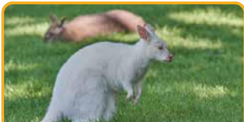
布鲁尼岛独有的白色袋鼠 White Kangaroo

午餐后，前往岛上的 生蚝农场，品尝塔州最美味的生蚝* (自费) Oyster Farm, Taste Oyster* (at your own expense) 。观光布鲁尼岛上热闹非凡的 冒险湾 Adventure Bay ，寻找布鲁尼岛上独有的 白色袋鼠 White Kangaroo 。岛上的山林间还藏有一些小店，可吃奶酪，尝海鲜，甚至可来一杯威士忌。