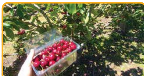
采摘车厘子 Cherry Picking*