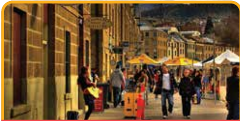
萨拉曼卡广场 Salamanca Place