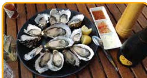
品尝塔州最美味的生蚝 Oyster Farm*