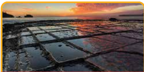
棋盘道 Tessellated Pavement

但是 酒杯湾 Wineglass Bay 坐落在群山之中，美丽不外露，游客们必须登高，花费一番力气之后才领略到她的美丽。途中停靠美丽的滨海小镇 斯旺西 Swansea ，从不同角度全方位欣赏塔斯马尼亚东海岸，从不同角度全方位欣赏塔斯马尼亚东海岸的美景。