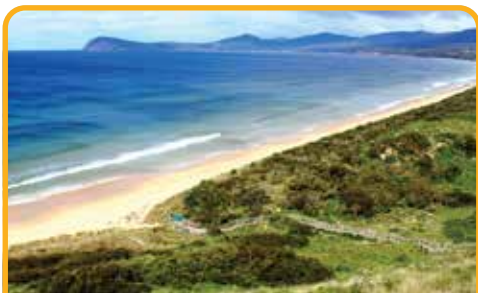
冒险湾 Adventure Bay