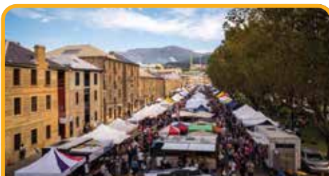
萨拉曼卡广场 Salamanca Place