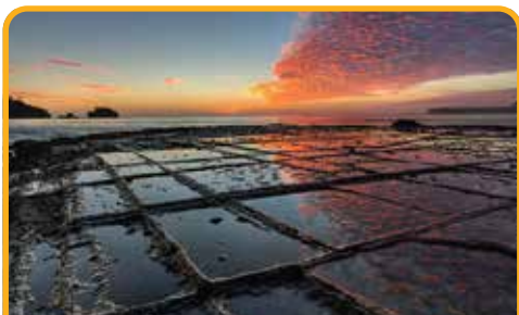
棋盘道 Tessellated Pavement