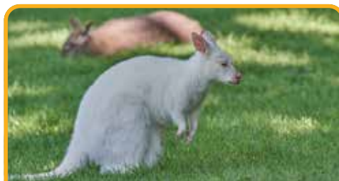
布鲁尼岛独有的白色袋鼠 White Kangaroo