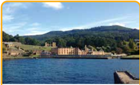
亚瑟港监狱遗址 Port Arthur*