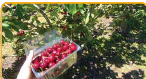
采摘车厘子 Cherry Picking*