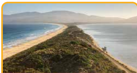
布鲁尼岛南北一线 The Neck