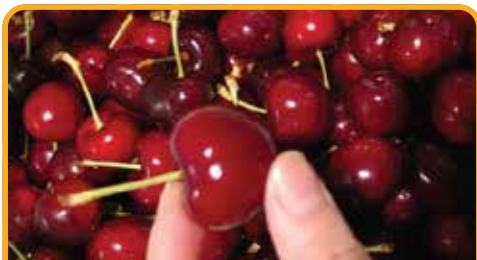
采摘车厘子 Cherry Picking*

早餐后, 前往塔斯曼半岛 亚瑟港监狱遗址* (自费) Port Arthur* (at your own expense) , 这里是殖民地时代流放罪犯的遗址, 已被联合国教科文组织列入世界遗产。在这里可以看到19世纪成千上万名英国囚犯被流放到这里后的生活情景。南半球最大的监狱, 依山傍海, 没有围墙, 以及海景牢房, 犹如一幅美好的风景油画, 绝对会颠覆你对监狱固有的印象。回程途中, 我们还将游览 喷水洞 Blow Hole 、 塔斯曼拱门 Tasman Arch 、 棋盘道 Tessellated Pavement 和 魔鬼厨房 Devil's Kitchen 等当地著名旅游景点。