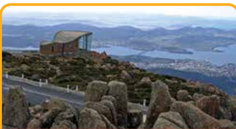
南天第一峰：惠灵顿山 Mt Wellington