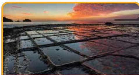
棋盘道 Tessellated Pavement