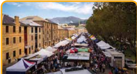
萨拉曼卡广场 Salamanca Place

行程的最后来到独具风韵的 里奇蒙 Richmond , 小镇有 澳大利亚最古老的石桥 Stone Bridge 和 最古老的天主教堂 Church , 是澳大利亚保存最完善的古镇, 体验时光倒流 180 年, 邂逅昨夜梦中的怀旧世界。可以去小镇上的糖果屋和网红面包店, 品尝一下颇有名气的扇贝派哦。