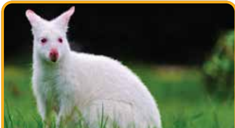
布鲁尼岛独有的白色袋鼠 White Kangaroo

塔斯马尼亚东海岸是一个梦幻世界, 蓝天、白云、彩色的海水和多彩的礁石将塔斯马尼亚东海岸点缀得一个五彩缤纷, 酒杯湾在 1999 年由美国旅游杂志《Outside》评选酒杯湾为世界十大海滩之一, 评论如此描述: “沙滩与塔斯马尼亚形成轮廓分明的半月形状, 犹如‘祝君愉快’扣纽扣上的笑脸一般……”但是 酒杯湾 Wineglass Bay 坐落在群山之中, 美丽不外露, 游客们必须登高, 花费一番力气之后才领略到她的美丽。途中停靠美丽的滨海小镇 斯旺西 Swansea , 从不同角度全方位欣赏塔斯马尼亚东海岸。