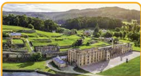
亚瑟港监狱遗址 Port Arthur*