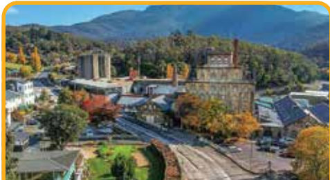
啤酒厂 Cascade Brewery

午餐后, 前往岛上的 生蚝农场, 品尝塔州最美味的生蚝* (自费) Oyster Farm, Taste Oyster* (at your own expense) 。观光布鲁尼岛上热闹非凡的 冒险湾 Adventure Bay , 寻找布鲁尼岛上独有的 白色袋鼠 White Kangaroo 。岛上的山林间还藏有一些小店, 可吃奶酪, 尝海鲜, 甚至可来一杯威士忌。