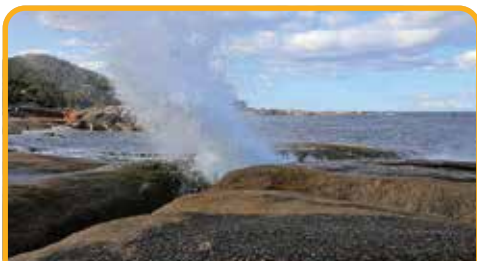
喷水洞 Blow Hole